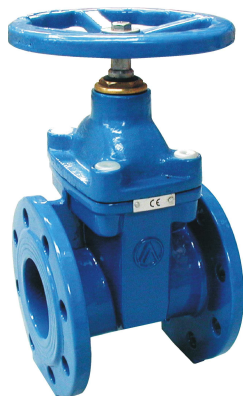
POSÚVAČ S 24 118-610/16